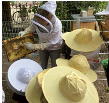
In der Kita kinderzimmer am Standort Bergstedter Scheune sind zwei Honigbienenvölker eingezogen.

Mit strahlenden Augen, viel Neugierde und manchmal auch vorsichtiger Zurückhaltung haben die Kinder der Kita kinderzimmer Bergstedter Scheune ganz viele neue, summende Nachbarinnen willkommen geheißen. Seit dem 21. Juni 2024 bewohnen zwei Honigbienenvölker das weitläufige und grüne Außengelände der Kita.